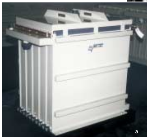
Abb. 2: Festbett-Elektrolyse zur Rückgewinnung von Schwermetallen (z.B. Cu, Zn, Hg, Pb, Sn, Ni) aus industriellen Abwässern mit niedriger Eingangskonzentration (<100 mg/l)