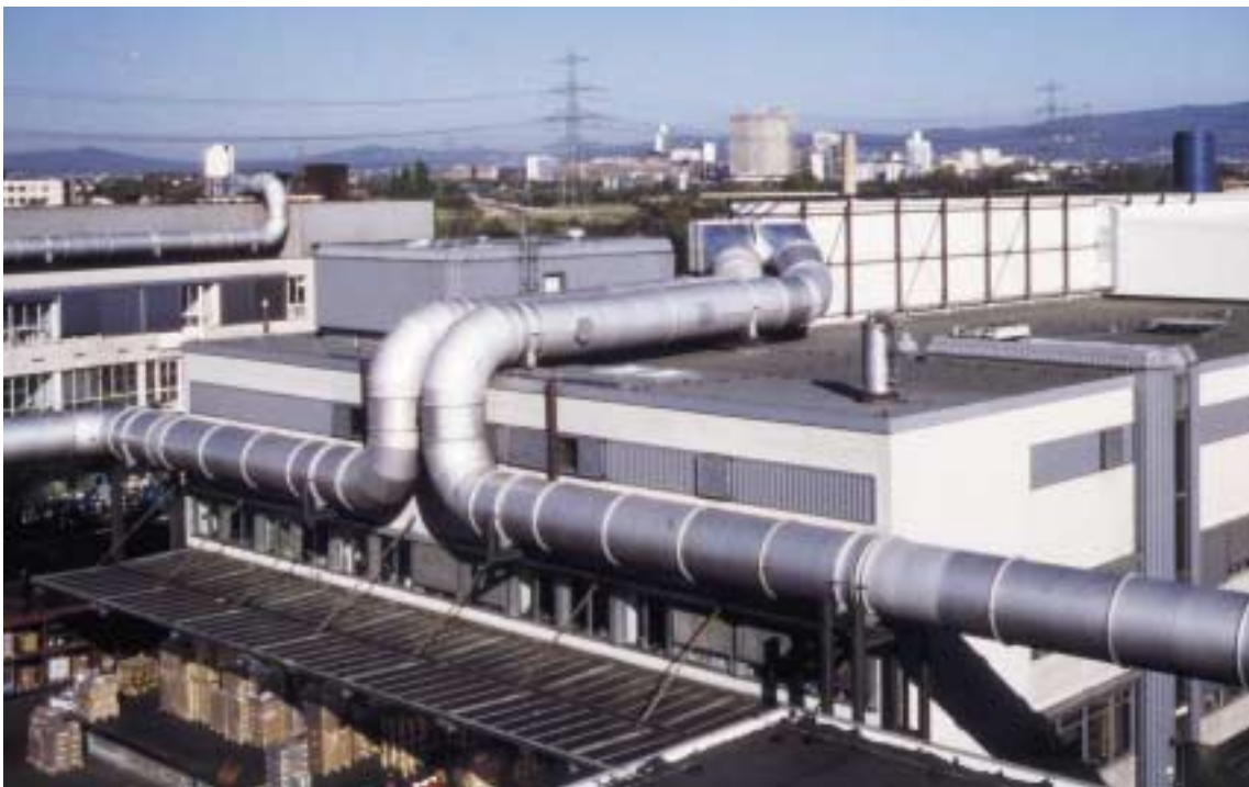
Abb. 1: Rieselbett-Biofilteranlage zur Reinigung von 2 x 150.000 m 3 /h an lösemittelhaltiger Abluft bei einer Druckfarbenfabrik

Die Arbeitsgruppe „Technische Elektrochemie“ des DECHEMA-Instituts befaßte sich mit der Entwicklung elektrochemischer Verfahren für den Umweltschutz. Zahlreiche praktische Anwendungen fand die Festbettelektrolyse zur Rückgewinnung von Schwermetallen aus verdünnten Produktionsabwässern. Sie zeichnet sich durch hohe Abreicherungsgrade aus und wird vor allem zur Abtrennung von Kupfer und Quecksilber, z.B. aus Abwässern der chemischen Industrie, eingesetzt (Abb. 2). Gerhard Kreysa erhielt für diese Entwicklung 1980 den internationalen Chemviron-Umweltpreis.