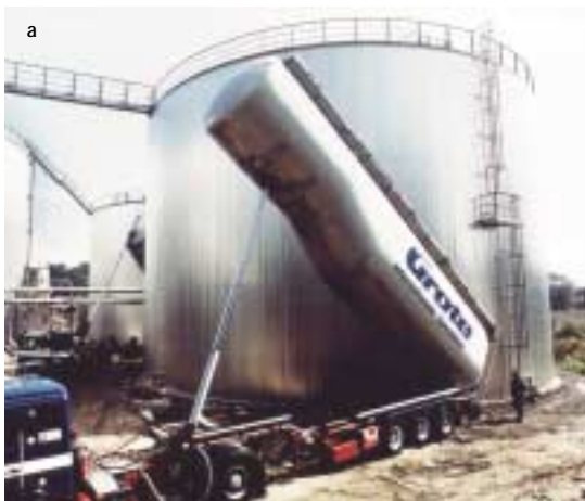
Abb. 4: Anaerobreaktoren mit immobilisierter Biomasse und Aktivkohle-beschichtetem PUR-Schaum als Trägermaterial zur biologischen Reinigung von Zellstoffabwässern mit einem hohen Anteil an schwer abbaubarem CSB durch Lignin- und Harzverbindungen

Auch bei der Diskussion des Themas „AOX-Minderung in Industrieabwässern“ bestätigte sich das differenzierte Bild vom Verhalten der CKW in der Umwelt (DECHEMA-Workshop 1995). Die vergleichende Auswertung der aquatischen Toxizität und Abbaubarkeit chlororganischer Verbindungen anhand verfügbarer Stoffdaten zeigte den begrenzten ökologischen Aussagewert dieses Parameters, insbesondere zur Bewertung niedriger Konzentrationen in Kläranlagenabläufen und Gewässern. Inzwi-