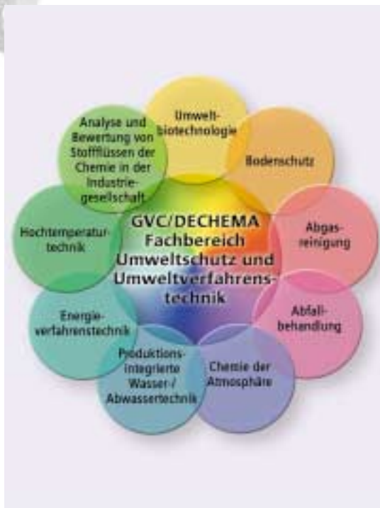
Abb. 3: Der GVC/DECHEMA-Fachbereich „Umweltschutz und Umweltverfahrenstechnik“ mit den kooperierenden Ausschüssen