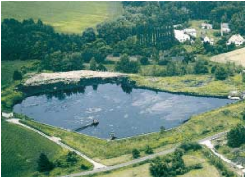
Abb. 6: Sanierung des Teersees „Neue Sorge“ in Rositz (Thüringen)

nisch-ökonomischen Grenzen der Grundwassersanierung in den letzten Jahren zunehmend ein neues Wissensgebiet in den Blickpunkt des Interesses, den kontrollierten natürlichen Rückhalt und Abbau von Schadstoffen, international geläufig unter dem Fachbegriff „Natural Attenuation“. Die verbesserte Kenntnis und Kontrolle des Schadstoffverhaltens im Untergrund soll Risiken für das Grundwasser erkennbar machen und eine bessere Abwägung von Sanierungsmaßnahmen und -zielen ermöglichen. In Fällen, wo eine biologische Selbstreinigung zwar nachweisbar ist, aber zu langsam verläuft, versucht man, durch Überwindung der limitierenden Faktoren zu neuen kostengünstigen Problemlösungen zu kommen (Enhanced Natural Attenuation).