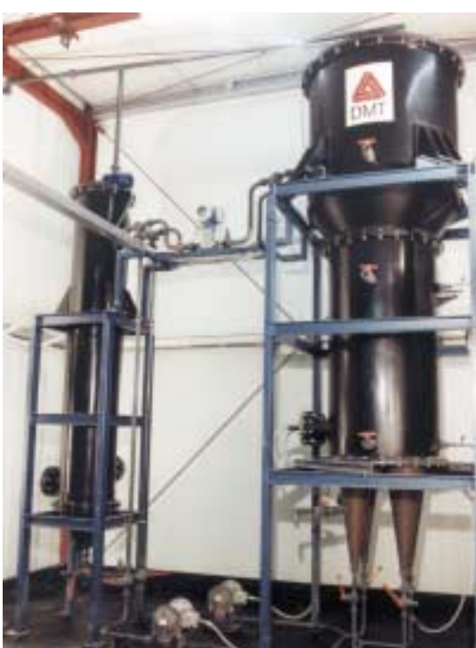
Abb. 5: Suspensionsbioreaktor (BIODYN-Verfahren) zur biologischen Reinigung von feinkörnigen Böden, die mit polycyclischen Aromaten (PAK) belastet sind; geeignet für Feststoffkonzentrationen bis 50% w/w. Ein 60 m 3 -Reaktor dieser Art wird in Schweden betrieben.

Die große Zahl frei werdender ehemals militärisch und industriell genutzter Flächen in den Jahren nach der Wiedervereinigung machte die Sanierung und verantwortliche Wiedernutzung solcher Standorte zu einem wichtigen und bis heute aktuellen Thema. Bei mineralölkontaminierten Böden lassen sich die Restgehalte an Kohlenwasserstoffen durch biologische Behandlung soweit absenken, daß keine Gefahr für das Grundwasser oder eine gewerblich-industrielle Weiternutzung mehr besteht. Die wissenschaftlichen Ergebnisse zeigten auch die Grenzen des erreichbaren Schadstoffabbaus bei niedrigen Restgehalten sowie bei biologisch schwer verfügbaren und schlechter abbaubaren Stoffen. Mit Verfahren, die den Zugang der Mikroorganismen zu den Schadstoffen und die Bedingungen des biologischen Abbaus verbessern, z.B. Suspensionsverfahren, kann diese Grenze verschoben, aber nicht grundsätzlich aufgehoben werden (Abb. 5).